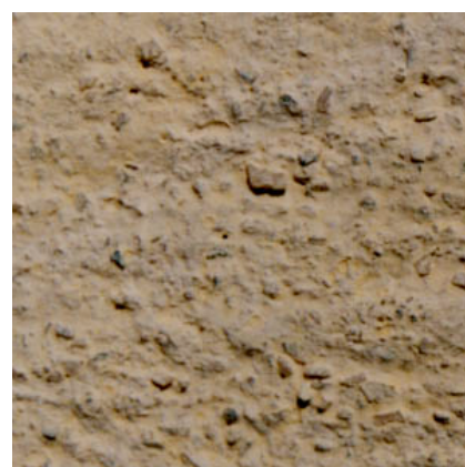
3 - Patine