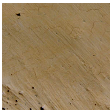
1 - Badigeon

Elle convient aux supports très poreux. Elle couvre moins vite le grain du sable et permet du coup des effets de transparence avec la texture du support.