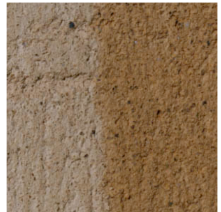
4 - Support poreux, mouillé.

Le support est compatible avec un lait de chaux s'il est poreux et minéral.